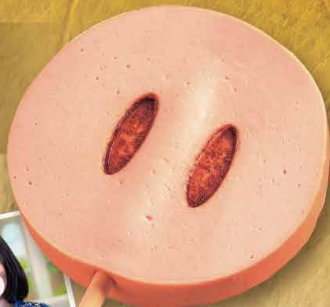
ポークソーセージ 400円