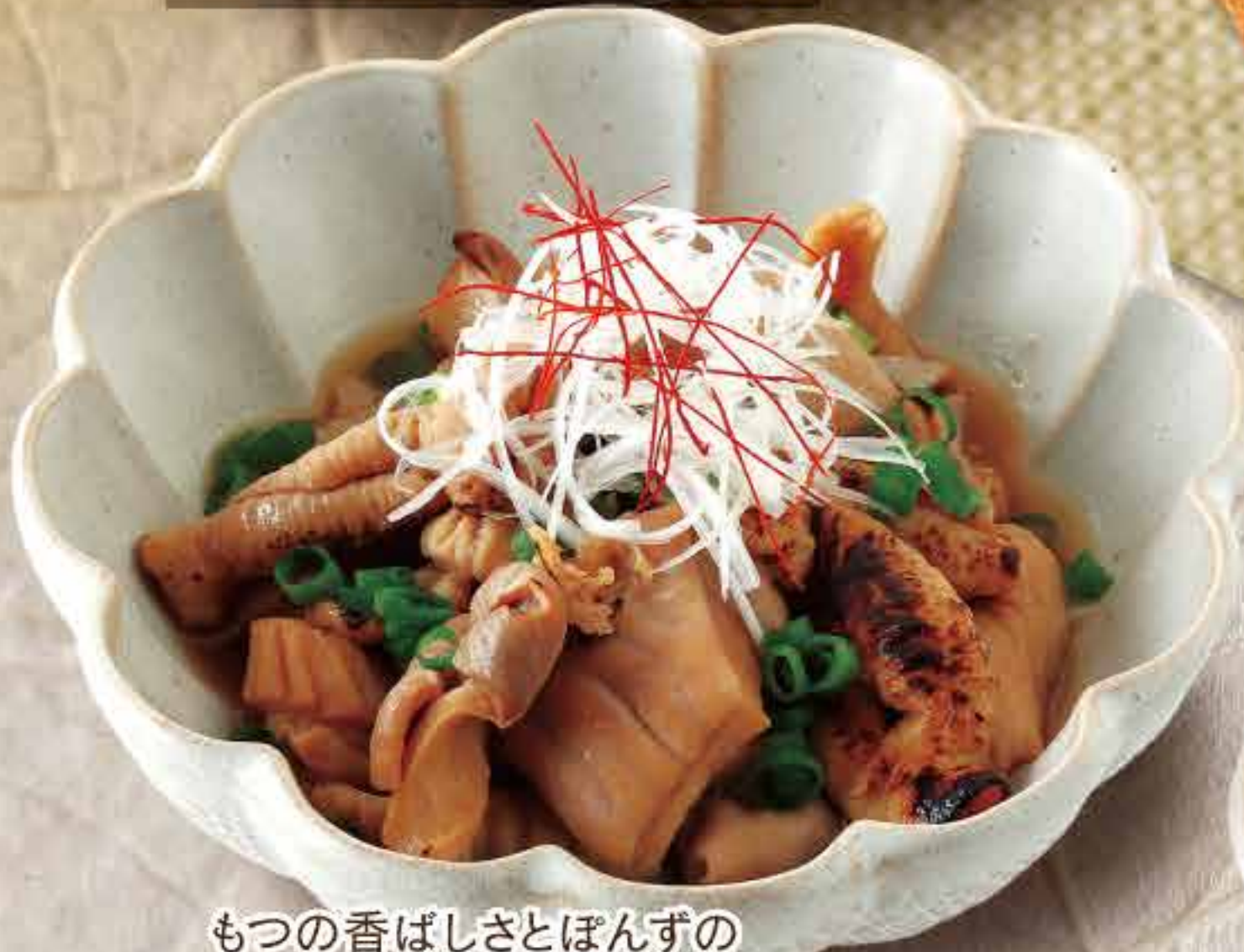
もつの香ばしさとほんずの さっぱりとした味わいです 炙りもつ 680円