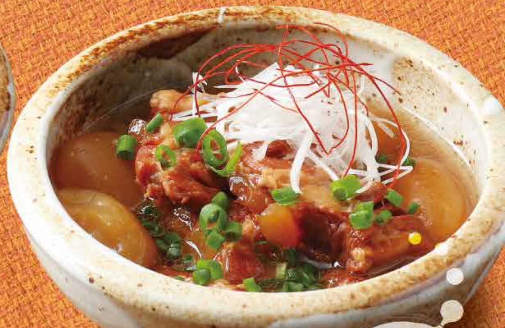
やわらかく煮込んでいます 玉こんにゃく入り バラ軟骨 680円