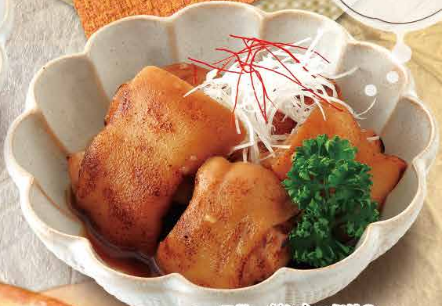
コラーゲンたっぷりの やさしいほん酢しょう油味 炙り豚足 680円