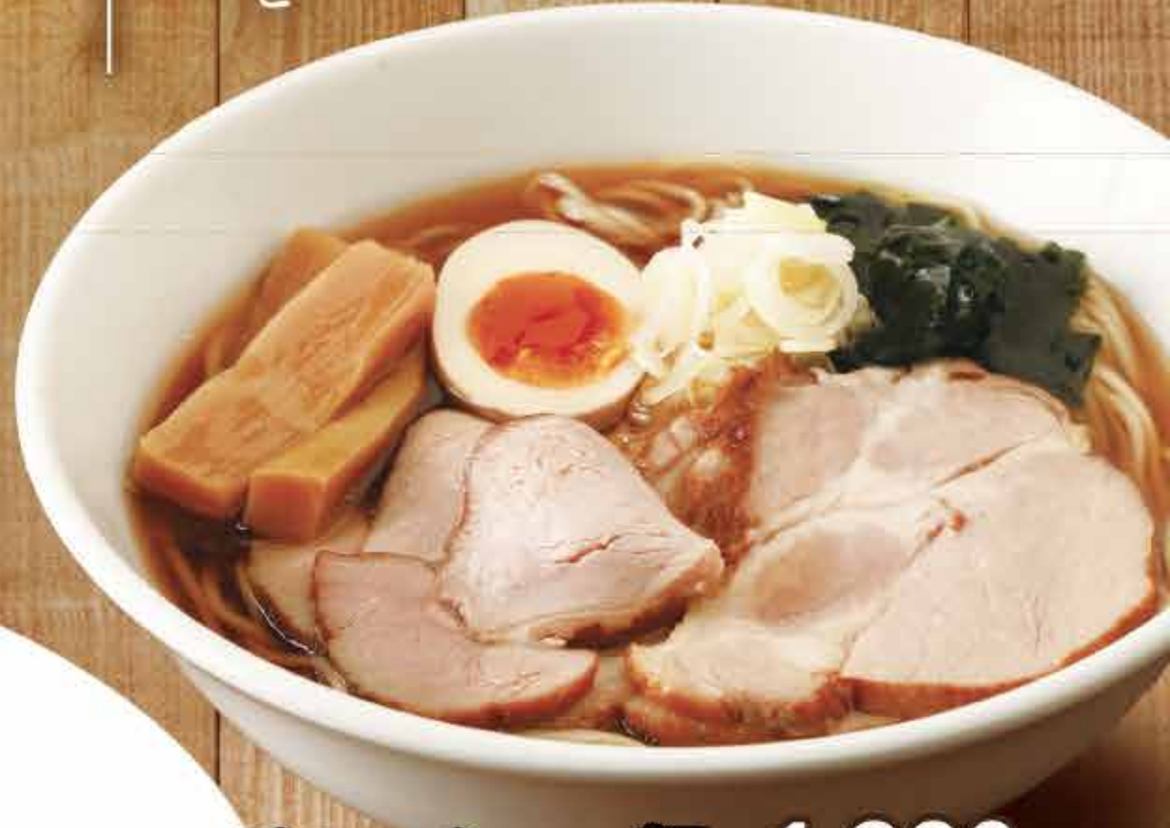
チャーシュー麺 1,380円