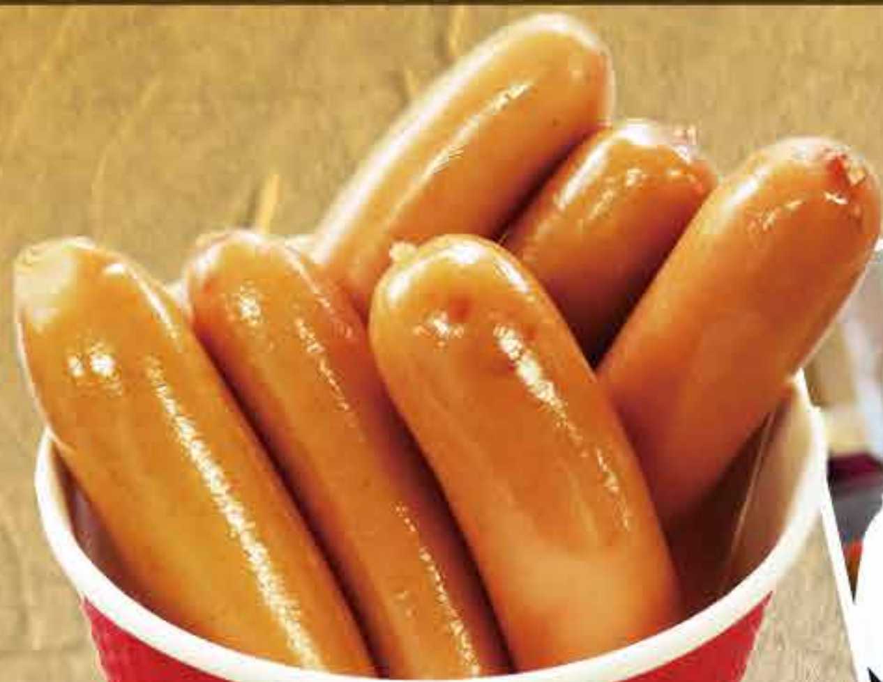
ウインナーカップ 400円