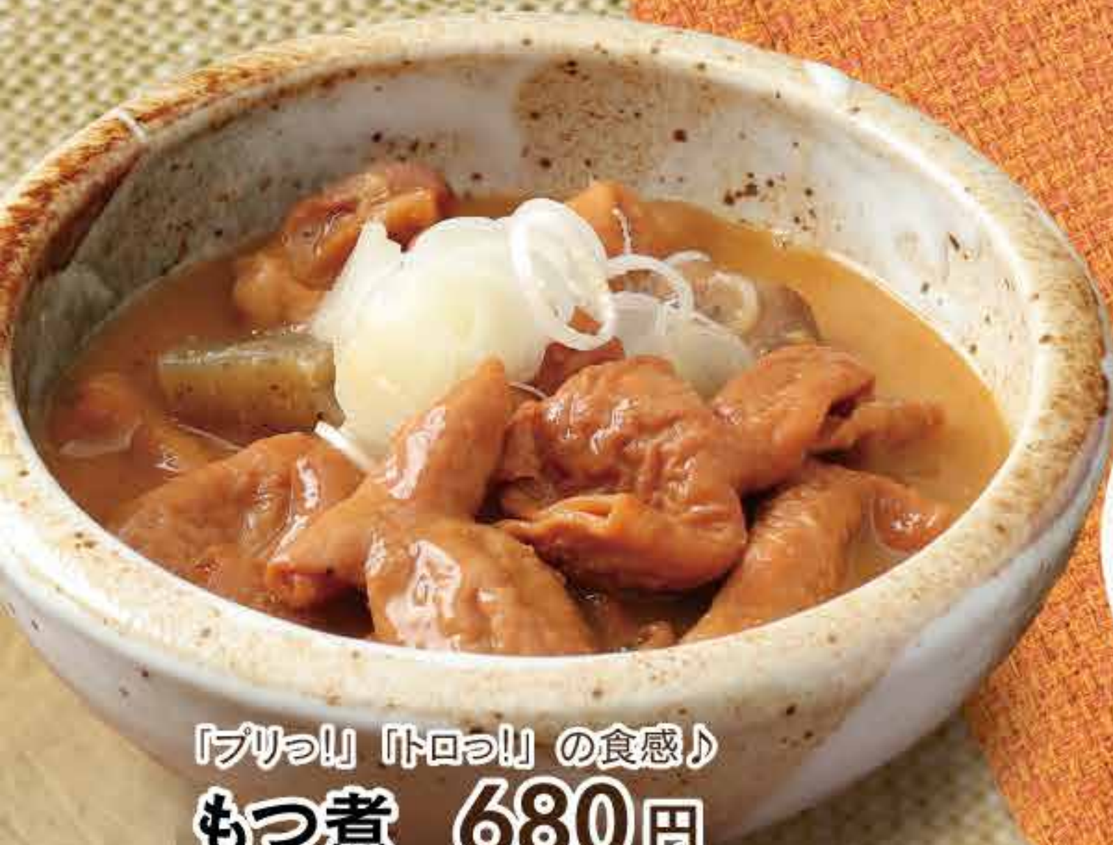
「プリッ!」「トロッ!」の食感♪ もつ煮 680円